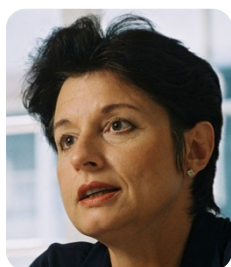
Referentin: Anita Fetz, Ständerätin, Unternehmerin

Welche Strategie ist gefragt, damit die Schweiz auch in Zukunft Sicherheit und Stabilität gewährleisten kann? Kann Wirtschaftswachstum auch ohne Bilaterale Verträge erreicht werden und welche Vorteile bringt eine Unternehmenssteuerreform?